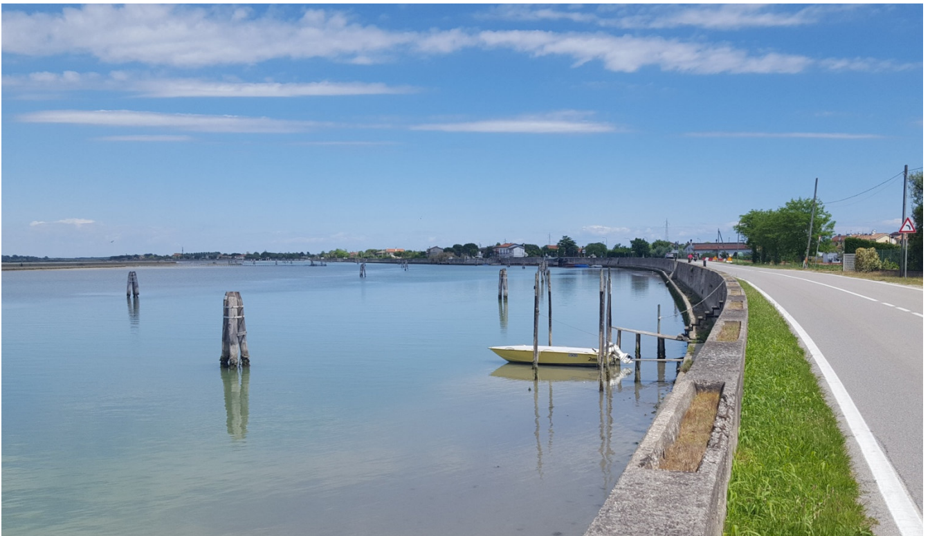
Vedute sulla laguna da via Pordelio