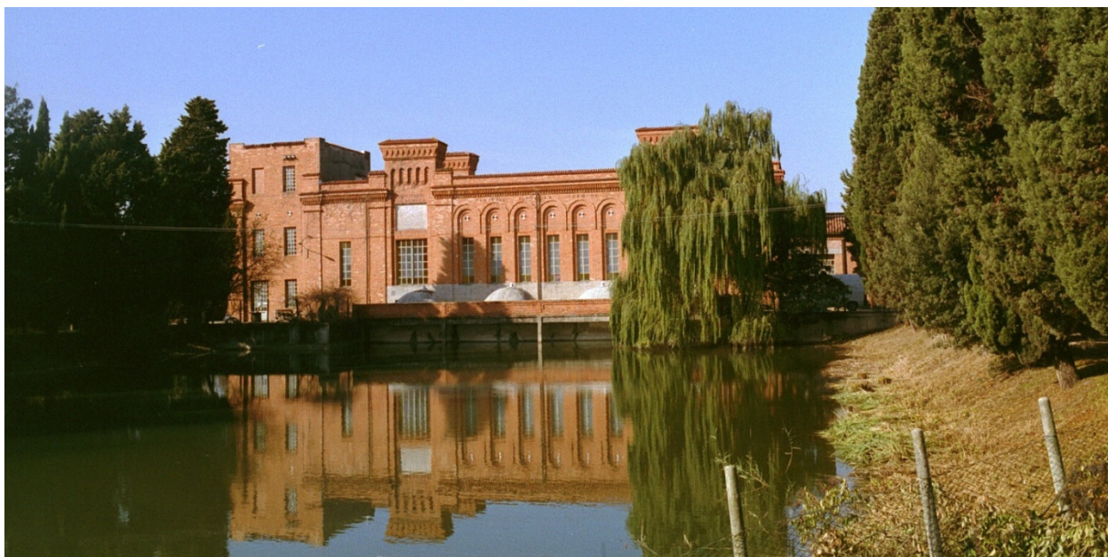
Idrovora del Termine

Partenza/Arrivo: San Donà di Piave, Museo della Bonifica (MUB). Volgendo le spalle al MUB si procede a sinistra e poi subito a destra per Via Code fino all'incrocio con Via Bassa Isiata. Qui si svolta a sinistra e, dopo circa 2 km, ancora a sinistra per Via Isiata giungendo nel centro dell'omonima frazione. Si prosegue quindi a destra pedalando per circa 1,5 km sulla trafficata e stretta strada provinciale fino al ponte sul canale Ramo .